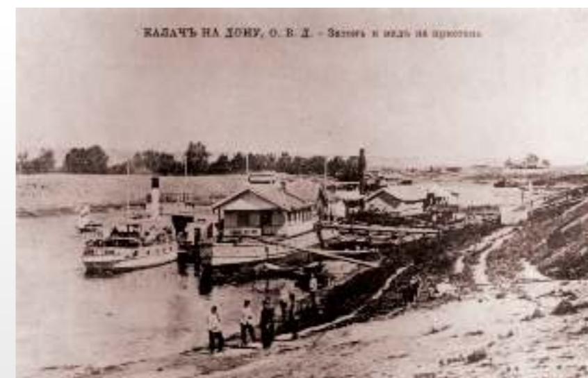
Затон и вид на пристань

В материалах Центрального статистического комитета Министерства внутренних дел по подготовке первой Всероссийской переписи населения 1897 г. Калач значится как торговый хутор, который имеет три паромные пристани на Дону, железнодорожную станцию Донская, казенную и земскую почтовые станции и почтово-телеграфную контору. В хуторе 553 двора и 2319 жителей.