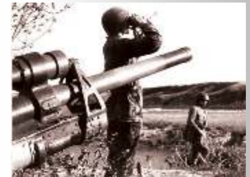
Орудия нацелены на Сталинград