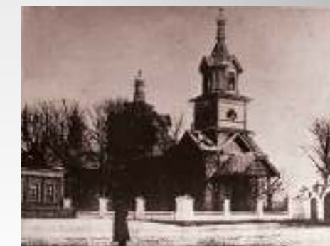
Храм святителя Николая Чудотворца в Калаче. 1869