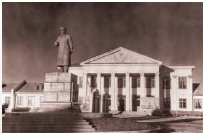
Управление строительства Волго-Донского канала. 25.02.51

Новый толчок развитию Калача дало строительство Волго-Донского судоходного канала в 1948 году. Управление строительством канала находилось в Калаче. Указом Президиума Верховного Совета РСФСР от 15 марта 1948 г. районный центр Калач был отнесен к категории рабочих поселков, а 18 апреля 1951 г. по решению Сталинградского облисполкома получил статус города районного подчинения. Для отличия от одноименного города в Воронежской области добавлено указание на местоположение «-на Дону».