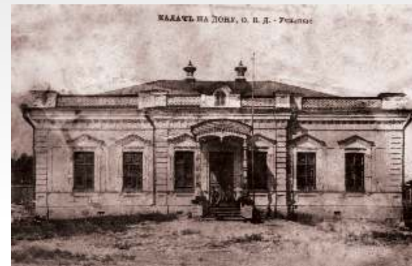
Двухклассное министерское училище в Калаче. 1890