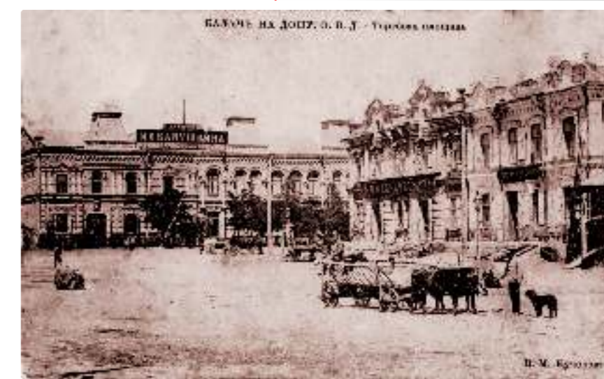
Торговая площадь. Конец XIX в.