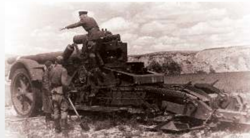
Немецкая гаубица в районе Калача. 1942