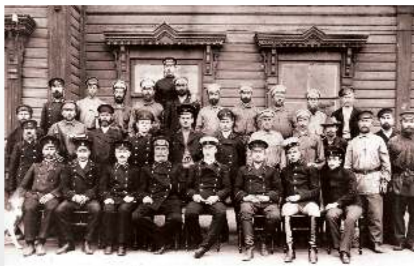
Коллектив железнодорожной станции

В 1859 г. между Царицыным и Калачом началось строительство одной из первых в России железных дорог, которая с большими трудностями, практически вручную была закончена в 1862 г.