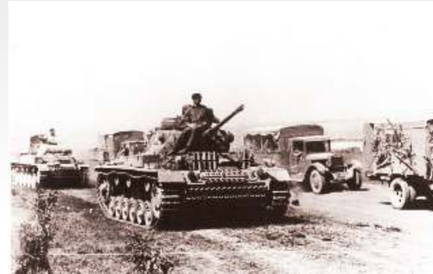
Передвижение гитлеровцев в излучине Дона. Октябрь 1942

Немецко-фашистские войска пытались нанести охватывающий удар по флангам советских войск, обороняющих подступы к Дону, прорвать их позиции и выйти в район Калача, чтобы затем стремительным ударом с ходу овла-